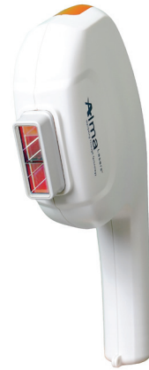
NIR Face wielkość plamki zabiegowej 6,4 cm 2 , moc od 5-25 W