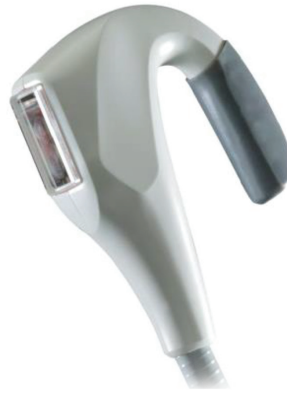
NIR Body głowica z chłodzeniem kontaktowym, wielkość plamki zabiegowej 18 cm 2 , moc od 50-100 W